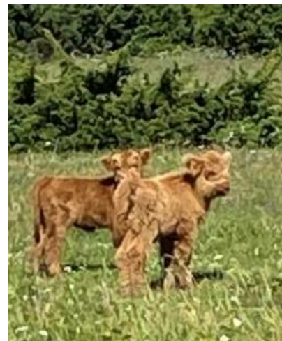
Kalvar, Highland Cattle, juli 2022

Din röst och ditt engagemang som medlem i byalaget är mycket viktig och vi hoppas att många kan komma på mötet.