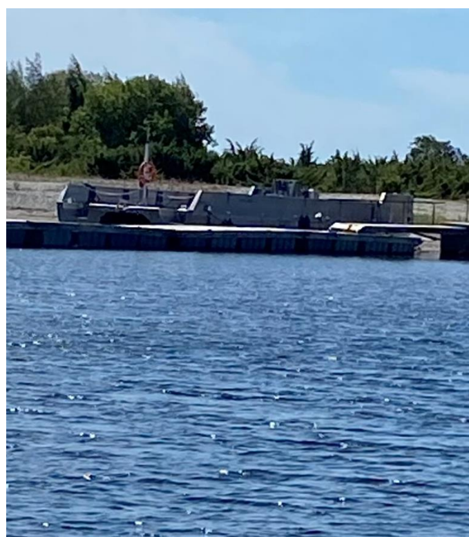
Den nya prämen i Storhamne juli 2022