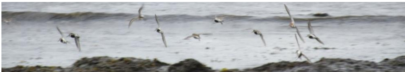
Vadarfåglar i juli 2015