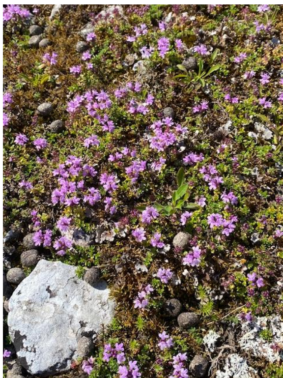
Backtimjan Odensholm juli 2022