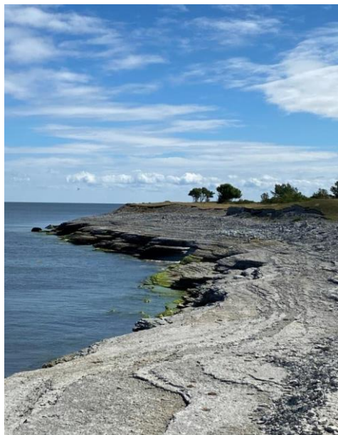
Norda Sia juli 2022

Medlemsavgiften till Odensholms byalag för 2023 är 150 kr/person. Avgiften är högst 400 Kr per familj som är bosatta på samma adress. Betalas till Odensholms byalags Bankgiro nr 281-2006 , Uppge namn, adress och gärna e-postadress när ni betalar in medlemsavgiften. Betalas helst in före 31 mars 2023.