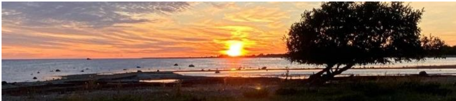
Sanna Sia, Västle kroken i juli 2022