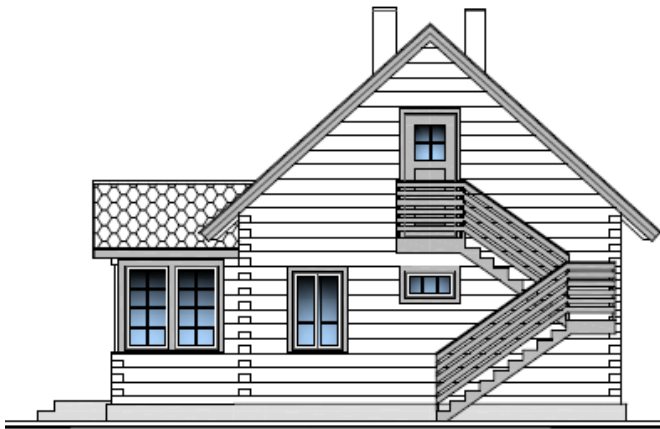
EAST ELEVATION M 1:100