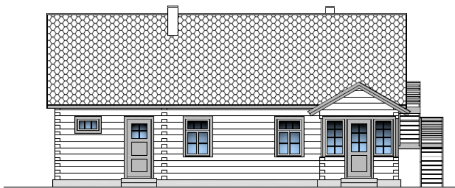
SOUTH ELEVATION M 1:100

Preliminära skisser för huset med prel. planritning. Av arkitekt Sirje Hammerberg i november 2017.