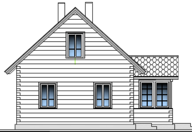
WEST ELEVATION M 1:100