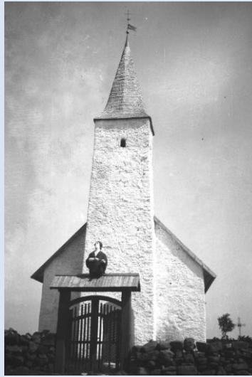
1852. aastal hukkunud briti laeva käälakuju. Osmussaare kabel, 1932. Foto Eesti Filmiarhiiv, EFA 1-8814