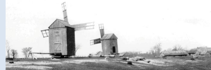
Tuulikumägi ( Koinbackan ), tagaplaanil Küla