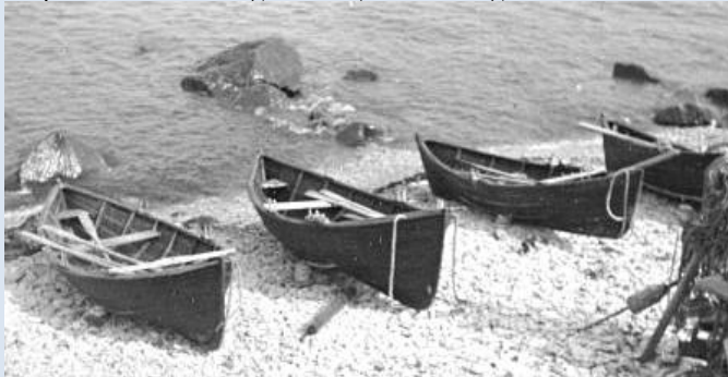
Tursapiüügi paadid, 1926.

Kirjalikes allikates on saart nimetatud juba 13. sajandil, aga nime usutakse pärinevat Viikingi või Rauaaajast ning seotakse viikingite jumala Odeniga. Temaga seob saart mitu legendi: üks rändrahn kandis Odeni nime ( Odens stain ), mida uskumustes peeti isegi Odeni hauakiviks. Teise pärimuse kohaselt olevat Oden Põõsaspea ( Spithamn ) neemelt astudes tühjendanud oma kingast liiva, millest saigi Osmussaar.