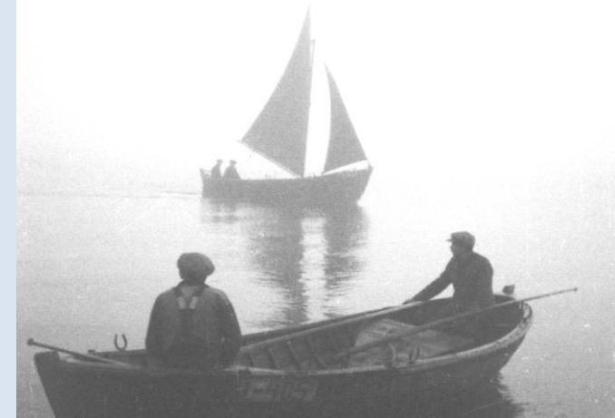
Kalapüük Osmussaarel, 1937.