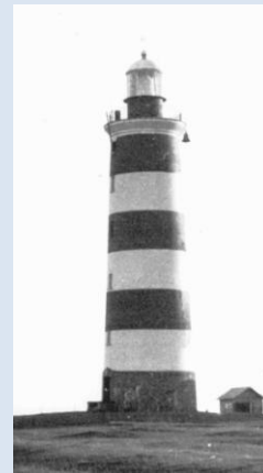
Osmussaare tuletorn ( Måjaken ) enne 1920 aastat.

Teadaolevalt, kuigi arvatavalt oli Osmussaarel juba keskajal väike puitkabel, ehitati esimene kabel saarele 16. sajandil. Tõenäoliselt asus see samal kohal, kus hilisem kivist Jeesuse kabel, mille varemed on saarel siiani säilinud. See kabel ehitati aastatel 1765-1766 kasutades kohalikku lubjakivi mõõtudes 12 x 7 meetrit. 10-meetrine torn paistis kaugele üle mere. Surnuaia värav oli ehitatud vanadest tammepalkidest, mis pärinesid ühelt laevavrakilt. Väravale asetatud Martin Lutheri büst oli tegelikult